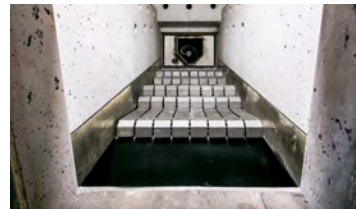
Vaakatasossa oleva porrasarina